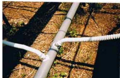
栽培ベッドからの排水回収